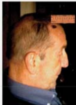
Begin behandeling worde = 2,5 cm